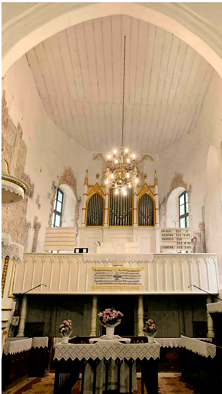
Helyszín: Visk, ref. templom. Időpont: 2025. október 18.