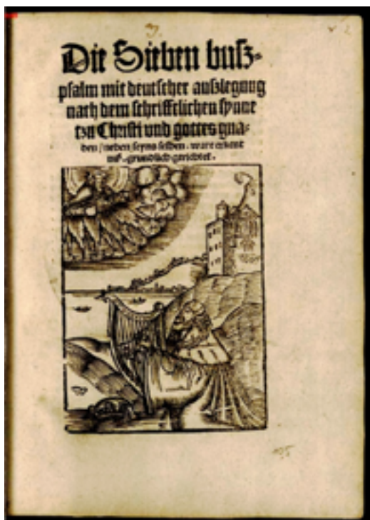
7. ábra. Luther hét bűnbánati zsoltárának címlapja

től, jelentésüktől kellett azokat megfosztani, új jelentést adni. 46 Luther már a 130. kapcsán fogalmazza meg: „Iste psalmus est de electissimis et principalibus psalmis, qui tractat illum principalem locum doctrinae nostrae, nempe iustificationem [...] quia isto articulo stante stat ecclesia, ruente ruit ecclesia.”