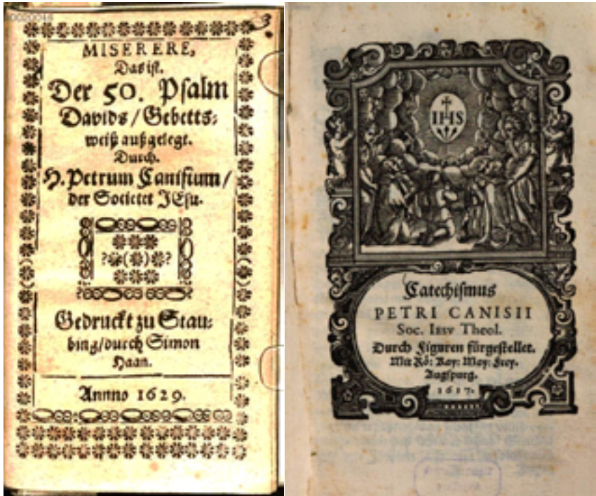
3-4. ábra. Petrus Canisius 50. zsolttárkiadása és katekizmusa

Durant, De ritibus ecclesiae catholicae (1592) című művéből származnak, illetve Petrus Canisius Manuale Catholicorum ából.