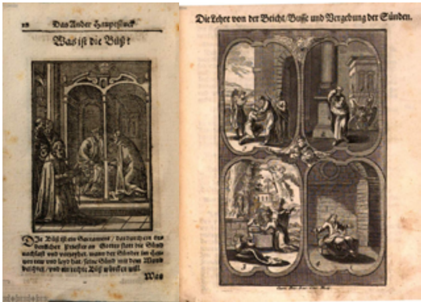
5–6. ábra. Canisius kátékiadásának metszetei

mennyire megerősítik a szöveg igazságait. A bűnbánathoz egy metszet csatlakozik, ahol egyértelműen gyónási jelenetet látunk: a térdelő gyónó gyóntatófülkében a pap fülébe mondja bűnvalló szavait. A füle előtt más gyónni készülő várakoznak. A metszet alatt magyarázat, amely egyértelmű: a bűnbánat/bűnvallás szentség, ami által egy hivatásos pap Isten helyett a bűnt elengedi és megbocsátja, amikor a vétkes szívből megbánja és szenved, a bűnét szájával meggyónja. 19