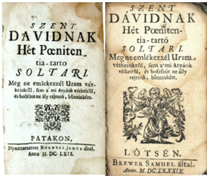
1-2. ábra. 1662-es és 1689-es kiadás

szövegalakítása konfesszionális szempontok alapján is zajlik. Eddig még nem tette meg ezt az összehasonlítást sem a Rimay, sem a Pázmány-filológia. Palásthy Krisztina pedig joggal kezdeményezi ezt a lépést és tesz néhány jelentős megfigyelést. A kis antológia nem nevezi meg a zsoltárparafrázisok költőit, de abban is különleges, hogy mindegyik darabja kifogástalan Balassi-strófában született . A szövegeket két esetben gondosan tördelve, az elkülönülő verssorokat megőrizve, a strofikus jellemzőket betartva közölték. Egyetlen kottát sem tartalmaznak a kötetkék, még nótajelzés sem található az egyes versek mellett.